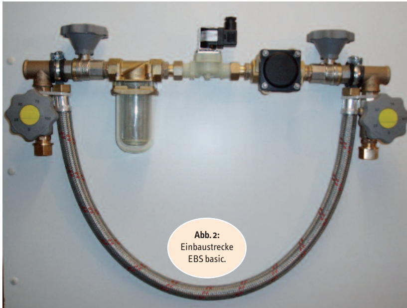
Abb. 2: Einbaustrecke EBS basic.