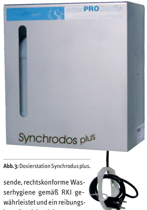
Abb. 3: Dosierstation Synchronodos plus.

Um eine Wasserkontamination auszuschließen und damit auch gesundheitsgefährdende Folgen für Patienten und Praxispersonal, sind eine Analyse des Praxiswassers sowie Keimtests anzuraten. Angeboten werden diese vom baden-württembergischen Hygienespezialist aquaPROdentis. Auch Wartungsverträge gehören zum Portfolio des Unternehmens. Für Zahnarztpraxen werden damit eine umfas-