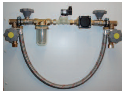
Abb. 1: Einbaustrecke EBS basic.

Um etwaigen mechanischen Schmutzpartikeln in der Trinkwasserversorgung wirksam zu begegnen, ist ein zentraler Schutzfilter im Wassereingangsbereich Stand der Technik (105–135 µm Maschenweite), allerdings fordern Dentalgerätehersteller eine Maschenweite von bis zu 20 µm. Die Filtration sollte auf zwei Stufen verteilt werden mit einem Vor- und Feinfilter. Empfehlenswert sind die aquaPROdentis-Einbaustrecken EBS basic (Abb. 1) und EBS plus, ggf. in Verbindung mit dem Spezialfilter Fe-Ex. Der Filter sollte am Übergang von der Frischwasserinstallation zur Dentaleinheit abgeschlossen werden, damit die Verschmutzungen direkt aus dem System beseitigt werden. Denkbar ist auch sein zentraler Einsatz, wenn unterschiedliche Materialien in der Frischwasserleitung verwendet wurden. Der Filter verfügt über einen speziellen Einsatz, der wegen seiner Materialbeschaffenheit zuverlässig feine, auch schlammartige Schwebeteilchen des Installationsrohres herausfiltert. Nach sechs Monaten ist ein Filterwechsel angezeigt.