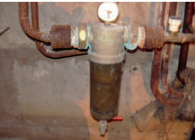
Verschmutzte Filter stellen eine Ursache der Wasserkontamination dar.

Die Europeanorm 1717 fordert für Dentaleinheiten eine Absicherung, die den Rückfluss von Wasser aus den Einheiten in das öffentliche Trinkwassernetz verhindert. Eine Gefahr der Wasserkontamination geht von den Bakterien in der Mundhöhle aus, die bei der Patientenbehandlung das rückfließende Wasser beeinträchtigen und zu Infektionen führen können. Hier hilft die Sicherungseinrichtung Flow-Neo von aquaPROdentis (Abb. 2a, b). Diese basiert auf dem Prinzip des „freien Auslaufs“ bzw. „freien Falls“. Dabei „fällt“ das Trinkwasser aus der Zuleitung über die vorgeschriebene Strecke von mindestens 20 mm in den Vorlagebehälter. Mit einer Druckpumpe und einem Druckausgleichsgefäß wird nun das drucklose Wasser zur Dentaleinheit gepumpt. Da sich beim Kontakt von Wasser mit Luft auch organische Ablagerungen bilden können, wird